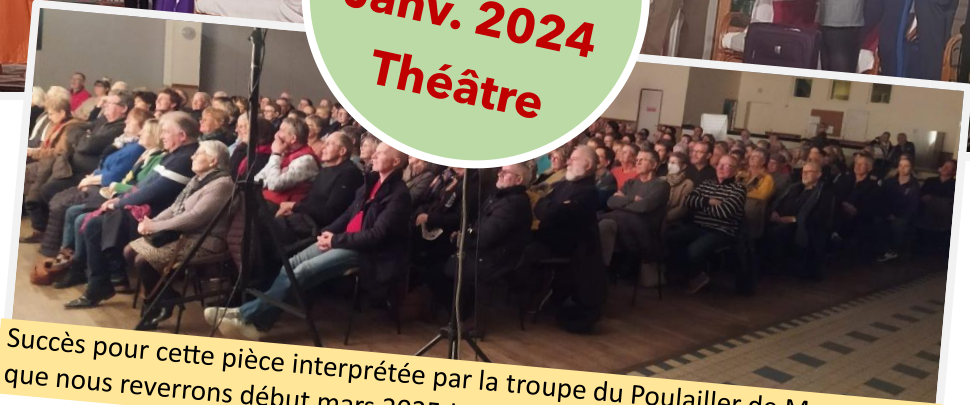
Succès pour cette pièce interprétée par la troupe du Poulailler de Montcocq que nous reverrons début mars 2025 !